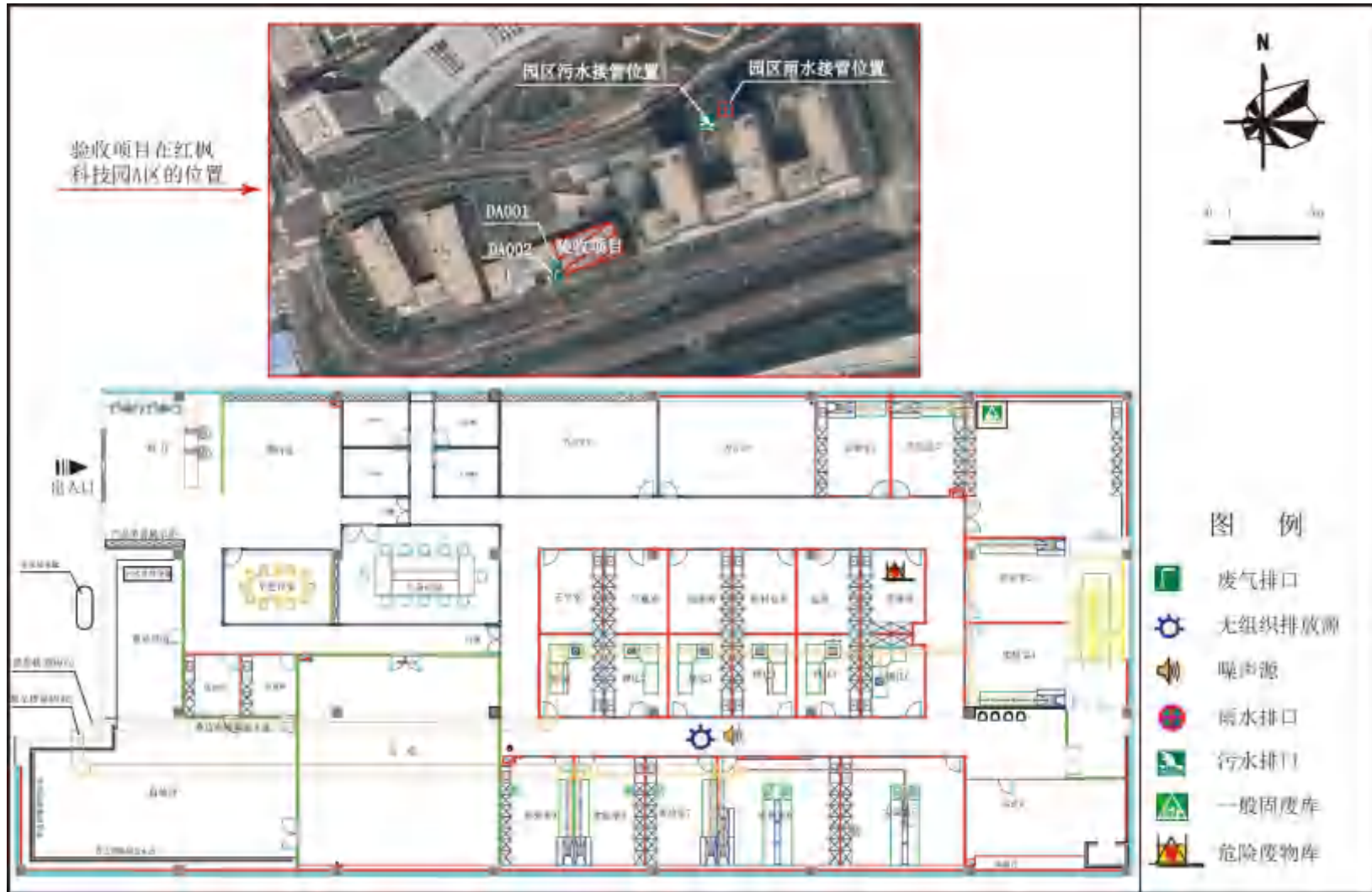
图 2.3-1 平面布置图