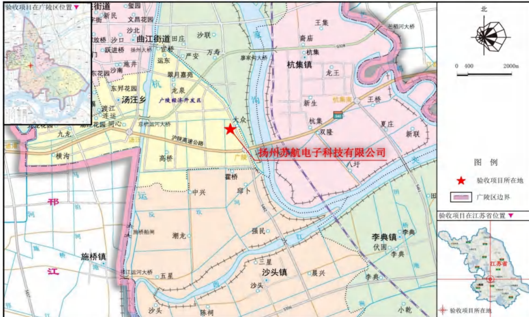
图 2.2-1 项目地理位置图

厂区平面布置情况见图 2.3-1，项目平面布置情况见图 2.3-2、2.3-3。