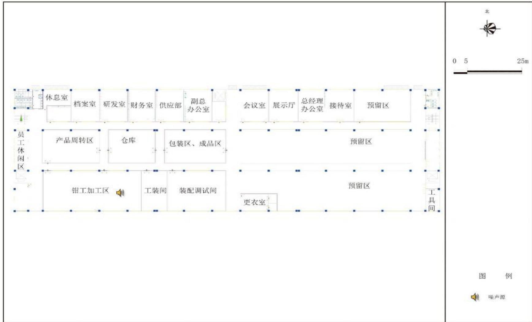
图 2.3-3 项目生产车间三（二层）平面布置图