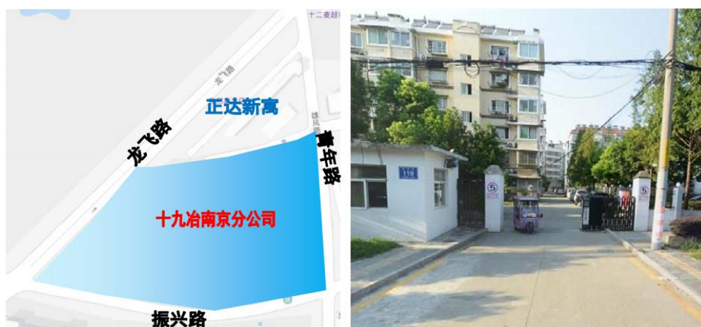
图 2-19 十九冶南京分公司片区位置区位及现状图

十九冶南京分公司片区位于雨花台区经济开发区，本片区位于龙飞路和振兴路的西北角处，北侧为正达公寓，东侧为青年路。本区片仅包括十九冶南京分公司。位置区位及现状图如图所示。