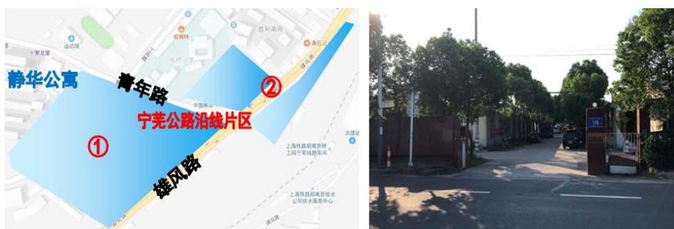
图 2-8 佳泽服装厂及沿线片区位置区位及现状图

佳泽服装厂及沿线片区位于板桥街道板桥社区，本片区包括位于青年路和雄风路的西南角处的佳泽服装有限公司、以及沿街的商业店铺和位于宁芜公路两侧的商业街，西侧紧挨着静华公寓。位置区位及现状图如图所示。