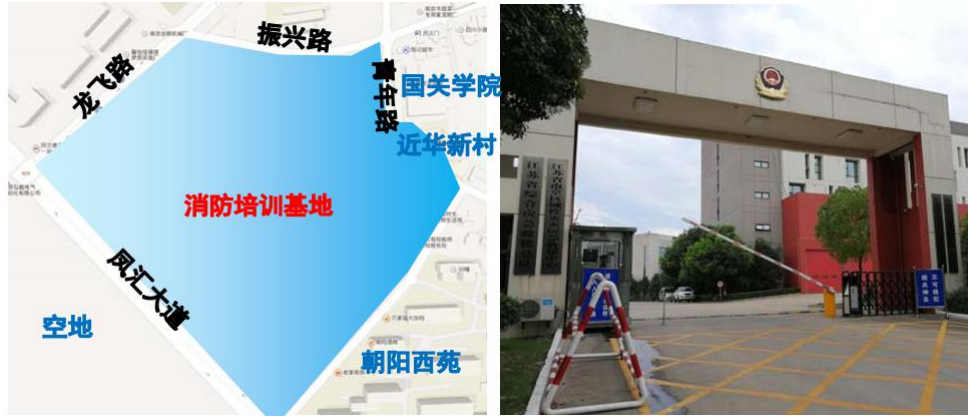
图 2-5 消防培训基地片区位置区位及现状图

消防培训基地片区位于板桥街道板桥社区，本片区位于龙飞路和凤汇大道的东北角处，东侧紧挨着朝阳西苑小区，北侧为振兴路和青年路。本区片包括消防培训基地、沿街的商业店铺、消防中心加油站以及近华新村。位置区位及现状图如图所示。