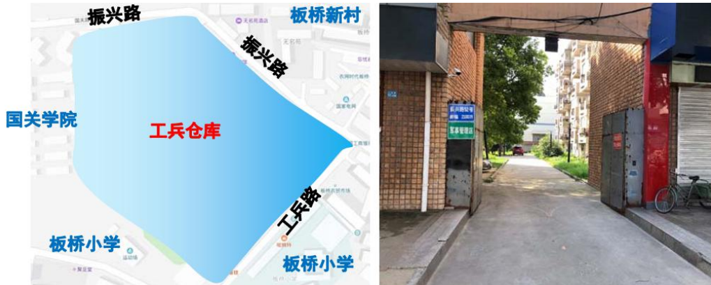
图 2-2 工兵仓库片区位置区位及现状图

工兵仓库片区位于板桥街道板桥社区，本片区位于振兴路和工兵路的西南角处，西侧紧挨着国际关系学院，南侧为板桥小学，东侧为工兵路，北侧为振兴路。本区片包括工兵仓库、以及沿街的商业店铺。位置区位及现状图如图所示。