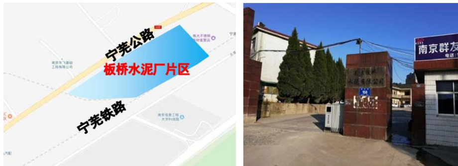
图 2-16 板桥水泥厂片区位置区位及现状图

板桥水泥厂片区位于板桥街道板桥社区，本片区位于宁芜公路和宁芜铁路的中间，北侧紧挨着宝钢集团梅山冶金公司铁路专用线。本区片只包括板桥水泥厂。位置区位及现状图如图所示。