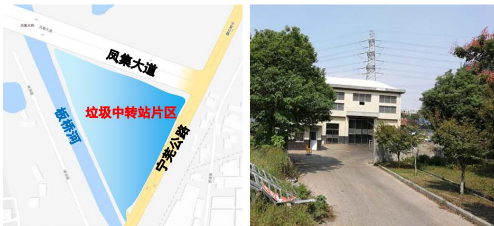
图 2-13 垃圾中转站片区位置区位及现状图

垃圾中转站片区位于板桥街道板桥社区，本片区位于板桥河和宁芜公路的东北角处，北侧为凤集大道。本区片仅包括垃圾中转站、华磊科技以及加油站。位置区位及现状图如图所示。