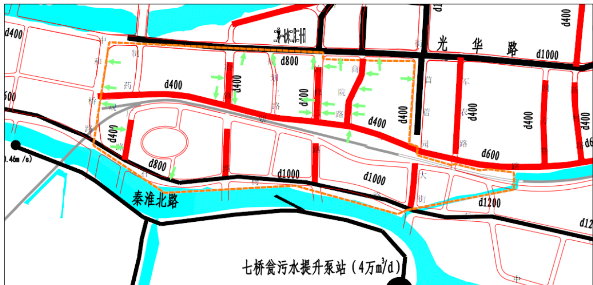
图 1-4 规划污水主次干管分布图

为满足排水达标区的建设需求，下一步需按照规划加快主次干管的建设。规划污水主次干管分布见图 1-4。