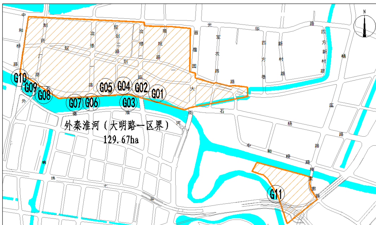
图 1-1 流域汇水范围排口分布示意图

本次涉及的 11 个排口 10 个位于外秦淮河（大明路—苜蓿园大街）段，分别编号为 G01-G10；1 个位于七桥瓮湿地公园，编号 G11。排口分布情况见图 1-1，排口出水情况见表 1-1。