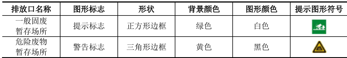
表 7-8 固废堆放场的环境保护图形标志